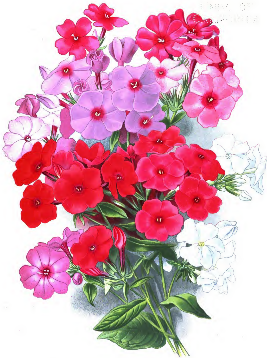
Phlox paniculata „ Phlox suffruticosa „Snowdown“.

Флокс [Огонек] многолетний и Флокс полукустарный „Снежные хлопья“.